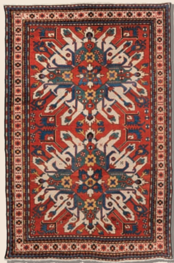
Tschelaber, Südkaukasus, letztes Drittel 19.Jhdt